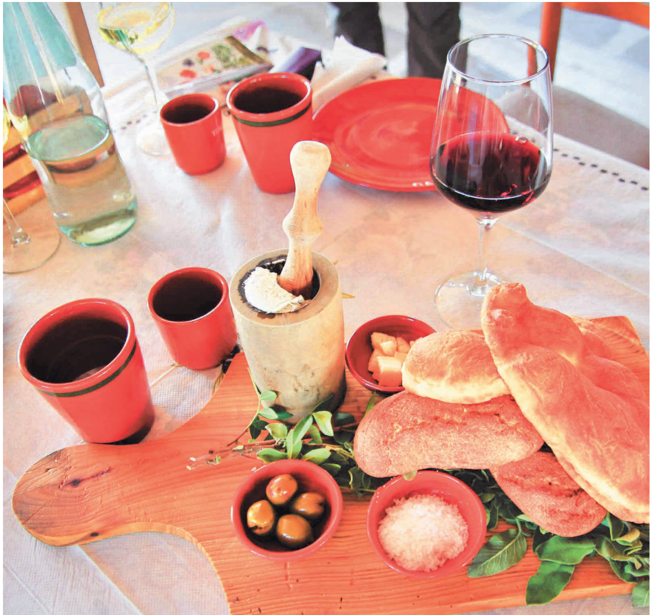
Viel braucht es nicht, um den authentischen Geschmack einer Region auf den Teller zu bringen. Lesen Sie mehr darüber auf Seite 3.

Das nächste Extra »aktiv & gesund« erscheint am 19. Juni Thema: aktiv und gesunde