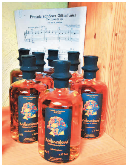
Ein Apfelbrand als Reverenz zum 250. Geburtstag des Musikgenies.

Brennerei Brauweiler Meckenheim: Tel.: (02225) 7585 www.brennerei-brauweiler.de