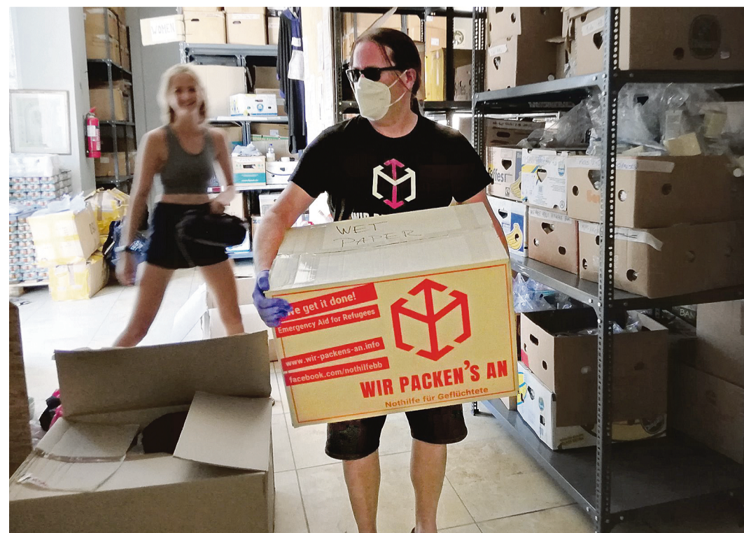
Viele Kisten mit Hilfsgütern stapeln sich in Fürstenwalde und werden von den Vereinsmitgliedern sortiert.

Es vergeht kein Tag, an dem die Vereinsmitglieder – inzwischen sind es 43 aller Alters- und Berufsgruppen – nicht aktiv dabei sind, auf die Situation der Menschen in den Flüchtlingslagern aufmerksam zu machen. Mit zahlreichen öffentlichen Aktionen. »Wir sind immer wieder beeindruckt, was für Ideen die Menschen entwickeln«, freut sich der