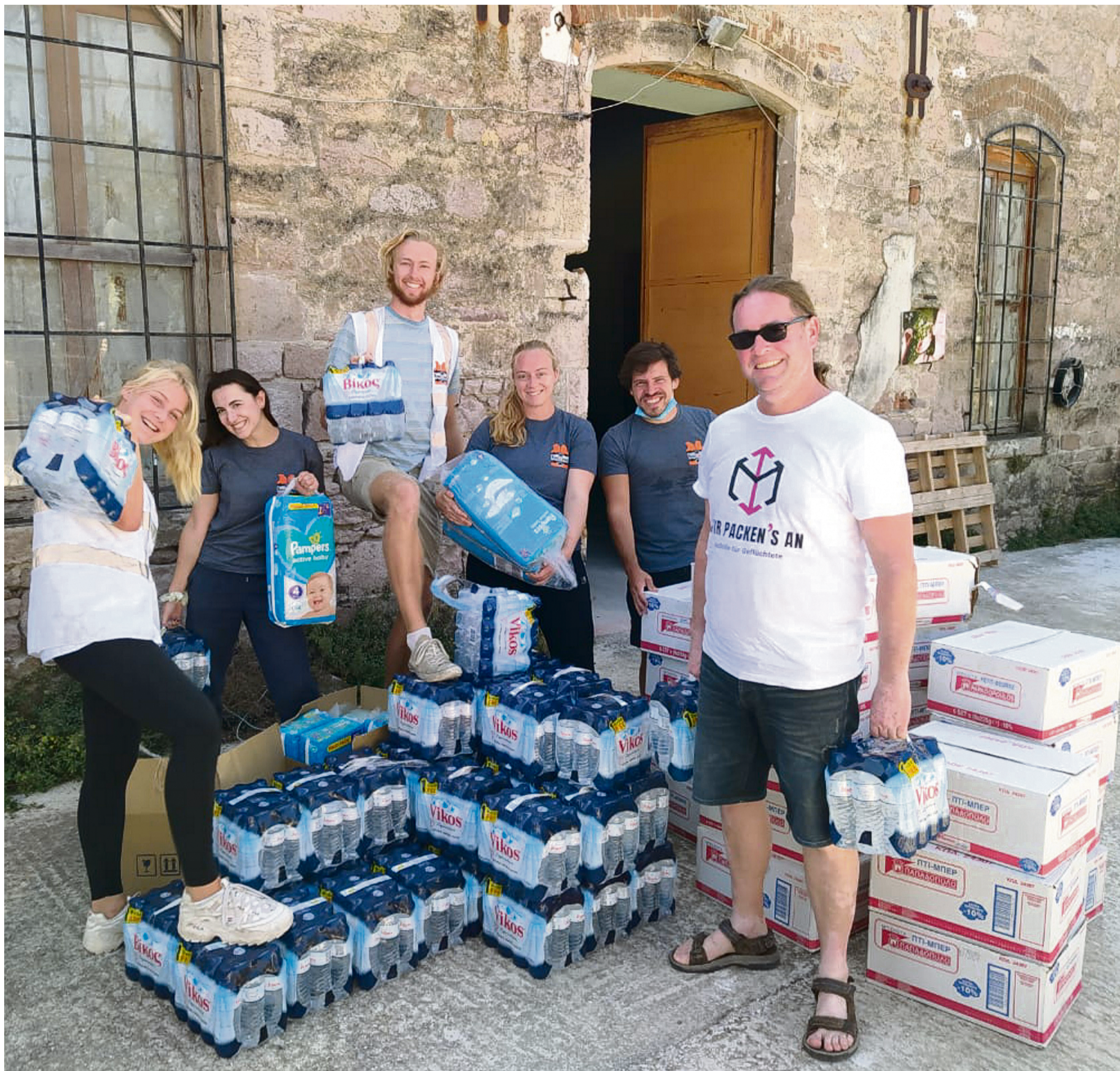
Mitglieder und Helfer des Vereins »Wir packen's an« verteilen Hilfsgüter für die Flüchtlinge, die durch den Brand im Lager Moria alles verloren haben (S. 3).

Das nächste Extra erscheint am 13. November, Thema: »aktiv & gesund«