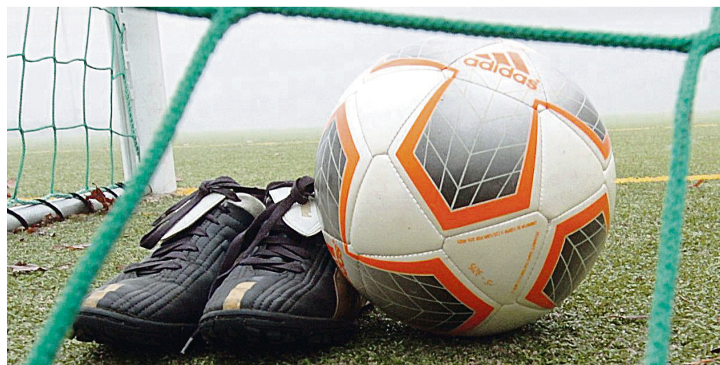
Im Verein spielen – mit Abstand.