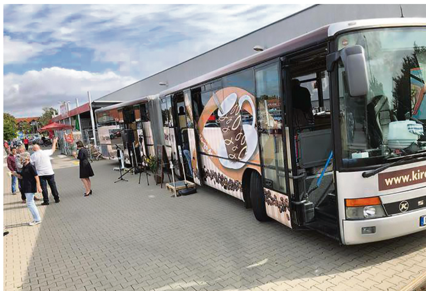
Der Bus kommt zu den Kaffeegästen