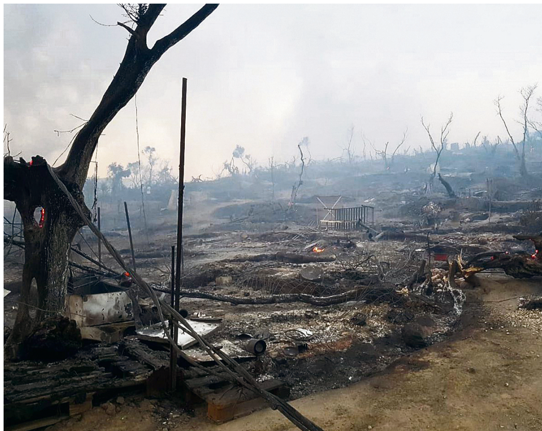
Nichts blieb übrig nach dem Brand im Flüchtlingslager Moria auf Lesbos.