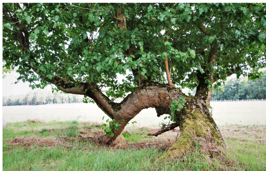
Wind und Zeit haben diesen uralten Maulbeerbaum in Zernikow geformt.